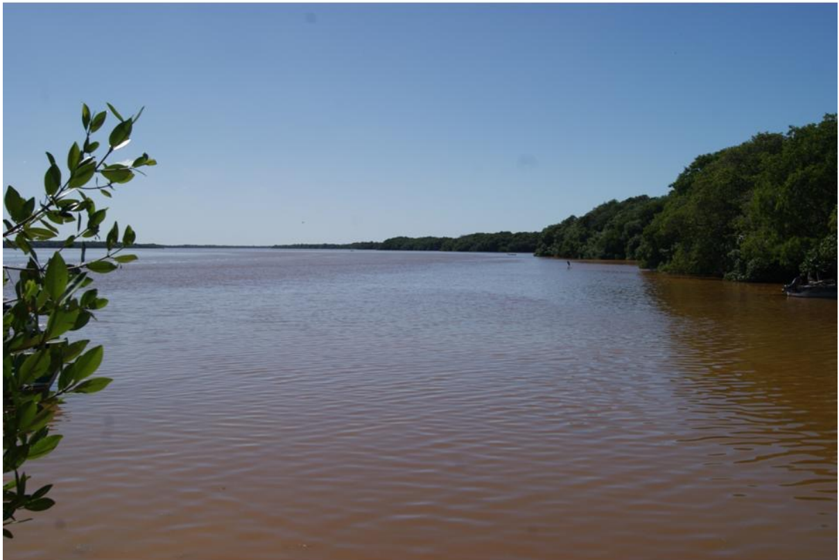
Ría Celestún cerca del poblado del mismo nombre.

la actual Ría Celestún. Las salineras que se aprecian en la misma fotografía aérea pueden ser los testigos de antiguos sistemas lagunares que quedaron estrangulados los cuales se fueron evaporando paulatinamente para dejar las costras de sal que son ampliamente explotadas en la región. Estas interpretaciones serán motivo de investigaciones más profundas. Lo importante, es destacar la gran variedad de condiciones geomorfológicas donde se han adaptado un enorme número de especies faunísticas y vegetales.